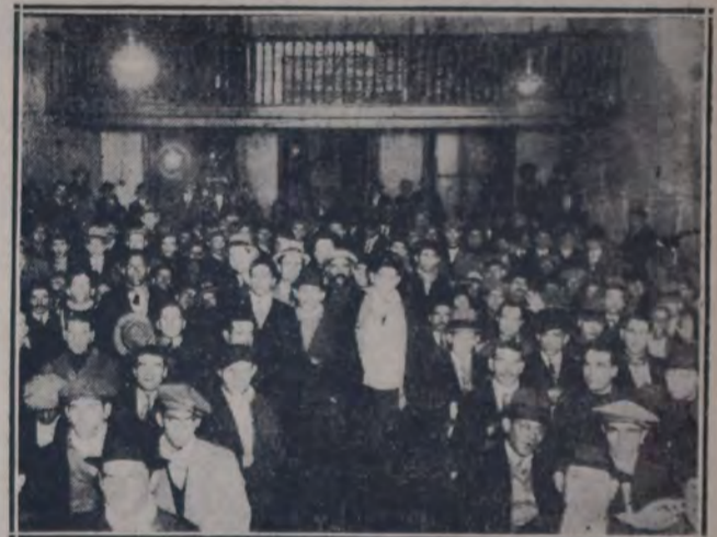
LA ASAMBLEA DE LOS LAVADORES DE COCHES, ACTUALMENTE EN HUELGA.

sabemos que es fácil que se rindan debido a la extensión del movimiento que ejerce una fértilísima presión. No obstante la resistencia que hasta ahora ofrecen los patronos alentados al parecer por las declaraciones del ministro del interior, que ha dicho, según las manifestaciones de la patronal: "Ha impartido las órdenes necesarias para que se dote a los garajes de vigilancia especial por todo el tiempo que dure el conflicto. De tal modo que todos los dueños de garajes pueden recibir de la comisaría seccional un servicio especial de vigilancia si lo creen necesario".