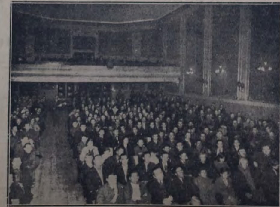
UN ASPECTO DE LA CONCURRENCIA AL ACTO ORGANIZADO POR LOS TRANVIARIOS.